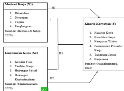
41 Gambar 1. Kerangka Berpikir

pekerjaan mereka sesuai jadwal karena kondisi kerja yang tidak nyaman. Ada penurunan kinerja karyawan akibat kurangnya motivasi dan kondisi lingkungan yang tidak memadai. Penelitian ini bertujuan untuk melakukan tiga hal: 1) menentukan bagaimana motivasi kerja mempengaruhi kinerja karyawan di Kopdit Mekar Sai; 2) menentukan bagaimana lingkungan kerja mempengaruhi kinerja karyawan di Kopdit Mekar Sai; dan 3) menentukan bagaimana motivasi kerja dan lingkungan kerja berinteraksi satu sama lain untuk mempengaruhi kinerja karyawan di Kopdit Mekar Sai.