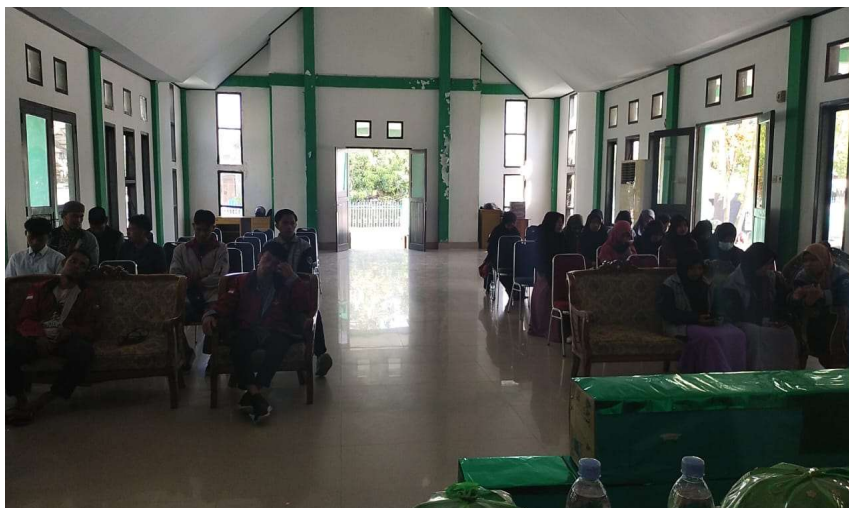
Gambar 2. Peserta Kegiatan Sosialisasi Undang-Undang Desa

Adapun target yang diharapkan dari kegiatan pengabdian ini adalah (1) Masyarakat mengetahui arti pentingnya keberadaan Undang-Undang Desa dalam mempercepat terwujudnya kesejahteraan masyarakat melalui peningkatan, pelayanan, pemberdayaan, peran serta masyarakat dan peningkatan daya saing daerah; (2) Menjadi pedoman bagi pemerintah desa dalam rangka penyusunan produk hukum yang ditetapkan di desa berdasarkan standarisasi sesuai ketentuan perundang-undangan; (3) Munculnya kesadaran masyarakat dalam keterlibatan penyusunan dan implementasi peraturan desa di Provinsi Sulawesi Tenggara pada umumnya dan khususnya di Desa Lipu Kabupaten Buton Tengah.