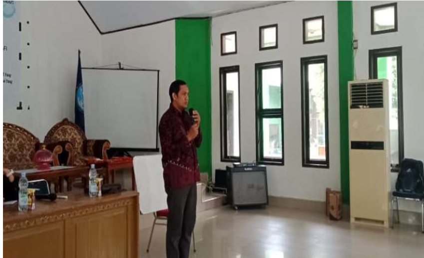
Gambar 1. Penyampaian Sosialisasi Pentingnya Undang-Undang Desa