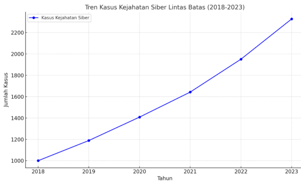
Gambar 1. Tren Kasus kejahatan Siber Lintas Batas (2018-2023)

Gambar 1 menunjukkan peningkatan signifikan jumlah kasus kejahatan siber lintas batas dari tahun 2018 hingga 2023, dengan tren yang terus naik setiap tahunnya. Peningkatan ini mengindikasikan bahwa ancaman siber lintas batas menjadi semakin kompleks, memerlukan pendekatan hukum dan teknis yang lebih canggih. Kondisi ini menekankan pentingnya bagi Indonesia untuk segera mengadopsi standar internasional seperti yang diatur dalam Konvensi Budapest, yang menyediakan kerangka kerja komprehensif untuk menangani kejahatan lintas batas. Tanpa harmonisasi dengan standar internasional, Indonesia akan terus menghadapi kesulitan dalam berkolaborasi dengan negara lain untuk menindak pelaku kejahatan siber. Selain itu, penundaan dalam adopsi standar ini dapat memperburuk kerentanan sistem hukum dan infrastruktur digital Indonesia terhadap serangan siber yang semakin terorganisasi. Oleh karena itu, langkah strategis diperlukan untuk memastikan bahwa regulasi nasional mampu mengakomodasi kebutuhan global dalam menghadapi kejahatan siber.