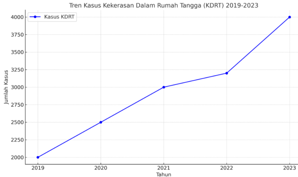
Gambar 3. Tren Kasus Kekerasan dalam Rumah Tangga (KDRD) 2019-2023

Untuk memberikan konteks tambahan, grafik di bawah ini menunjukkan tren perkembangan kasus KDRT di Indonesia selama lima tahun terakhir: