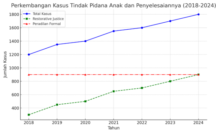
Gambar 1. Perkembangan Kasus Tindak Pidana Anak dan Penyelesaiannya (2018-2024)

ini mengandalkan berbagai metode, termasuk studi kasus dari beberapa kasus tindak pidana anak yang telah diselesaikan, wawancara dengan aparat penegak hukum seperti polisi, jaksa, dan hakim, serta analisis terhadap regulasi yang berkaitan dengan RJ. Data yang dikumpulkan tidak hanya memberikan gambaran mengenai tren kasus, tetapi juga mengungkap sejauh mana mekanisme ini telah diterapkan dalam SPPA di Indonesia. Gambar 1 menggambarkan perkembangan jumlah kasus tindak pidana anak dalam beberapa tahun terakhir serta bagaimana penyelesaiannya melalui dua jalur utama, yaitu RJ dan peradilan formal. Dengan adanya visualisasi ini, pembaca dapat melihat pola perubahan jumlah kasus serta pergeseran penggunaan pendekatan RJ dalam SPPA. Analisis terhadap data ini diharapkan dapat memberikan wawasan yang lebih mendalam mengenai efektivitas RJ dalam mengurangi dampak negatif sistem peradilan pidana formal terhadap anak pelaku tindak pidana.