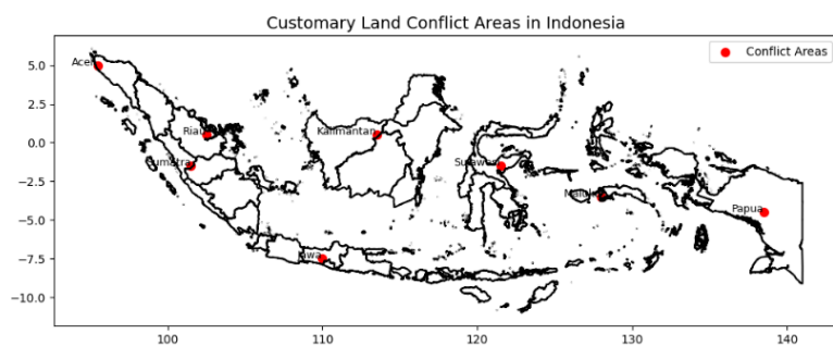
Gambar 1. Peta Wilayah Konflik Tanah Adat di Indonesia

Gambar 1 menyajikan peta wilayah konflik tanah adat di Indonesia berdasarkan laporan dan studi kasus dari tahun 2018 hingga 2023. Peta ini menggambarkan sebaran geografis sengketa tanah adat yang melibatkan berbagai komunitas di seluruh wilayah Indonesia. Data yang disajikan mencerminkan tingkat intensitas konflik di setiap daerah, yang bervariasi tergantung pada faktor-faktor sosial, ekonomi, dan kebijakan yang berlaku. Selain itu, peta ini juga menunjukkan tren peningkatan atau penurunan jumlah kasus dari tahun ke tahun, memberikan gambaran mengenai dinamika perubahan konflik yang terjadi. Informasi dalam gambar ini dikumpulkan dari berbagai sumber, termasuk laporan organisasi masyarakat sipil, penelitian akademik, serta data pemerintah yang berkaitan dengan permasalahan agraria. Dengan demikian, peta ini berfungsi sebagai alat analisis visual untuk memahami pola penyebaran sengketa tanah adat di berbagai daerah.