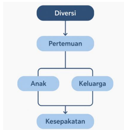
Gambar 3. Model Restorative Justice Diversi

Setelah memaparkan berbagai temuan tersebut, model yang ditawarkan dalam diagram di atas menegaskan bahwa proses diversi tidak hanya bertumpu pada aturan normatif, tetapi juga sangat dipengaruhi oleh dinamika interaksi antara anak, keluarga, korban, dan komunitas yang terdampak. Model tersebut menunjukkan bahwa keberhasilan diversi bergantung pada kualitas komunikasi restoratif, kesiapan psikologis pelaku anak, serta keterbukaan semua pihak dalam mencapai kesepakatan yang adil. Dengan demikian, model konseptual ini memperjelas area yang selama ini lemah dalam praktik diversi di Indonesia, yaitu minimnya integrasi perspektif korban dan pemulihan ekologis dalam forum musyawarah. Kejelasan visual dari model ini juga memperkuat rekomendasi penelitian agar forum diversi di Indonesia dilengkapi dengan mediator independen, konselor psikologis, dan ahli lingkungan, sehingga kesepakatan tidak hanya berorientasi pada pemulihan individual tetapi juga pemulihan kolektif.