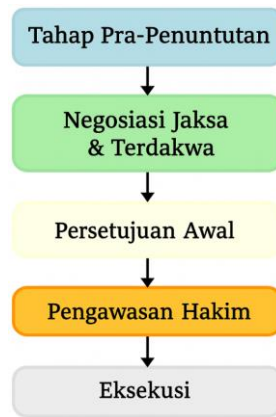
Gambar 2. Model Adaptasi Plea bargaining dalam Sistem Hukum Indonesia