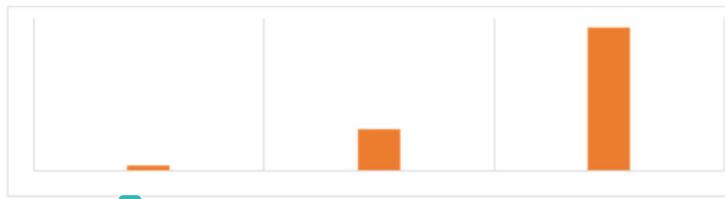
Gambar 1. Data transaksi TikTok Shop di Indonesia Tahun 2021-2023