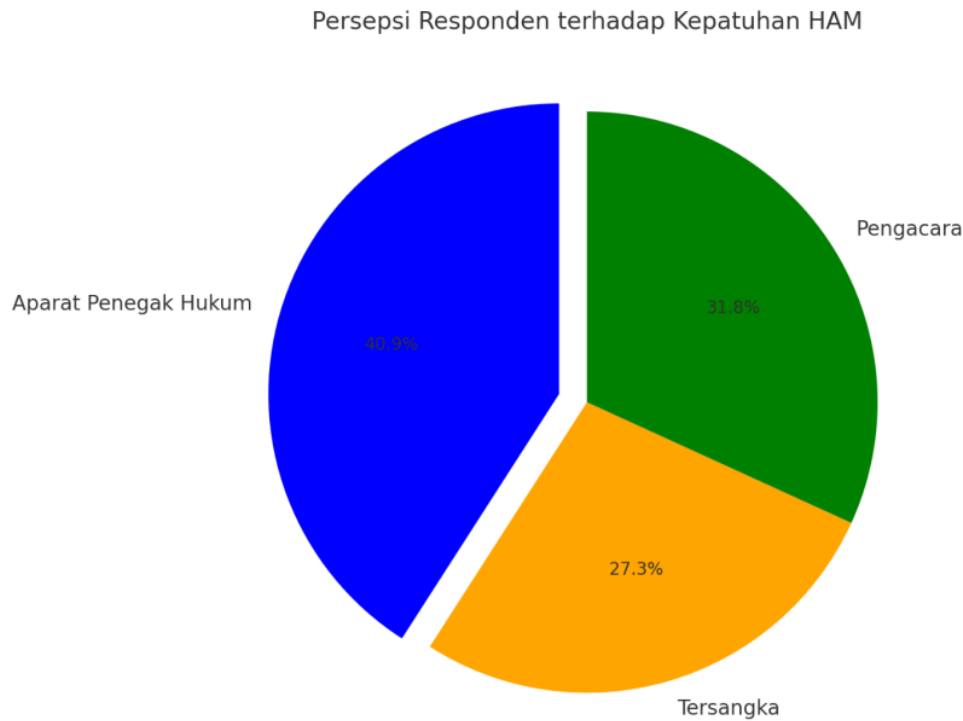
Gambar 2. Persepsi Responden terhadap Kepatuhan HAM

Gambar 2 menunjukkan distribusi persepsi aparat, tersangka, dan pengacara mengenai kepatuhan HAM.