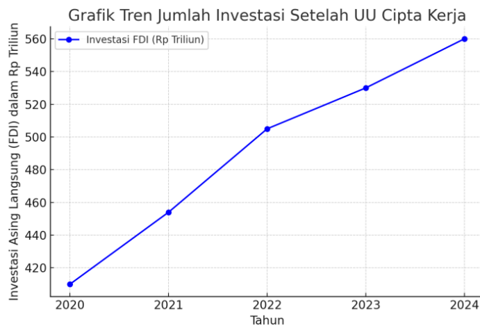
Gambar 1. Tren Investasi Asing Langsung di Indonesia 2020–2024

Gambar 1 menyajikan tren jumlah FDI di Indonesia sebelum dan sesudah diberlakukannya Undang-Undang Cipta Kerja. Grafik ini menggambarkan perubahan jumlah investasi dari tahun ke tahun, yang mencerminkan respons pasar terhadap kebijakan yang diterapkan. Data yang disajikan dalam gambar tersebut diambil dari berbagai sumber resmi, termasuk laporan BKPM dan publikasi pemerintah terkait investasi. Tren yang ditampilkan menunjukkan bagaimana faktor regulasi berpengaruh terhadap keputusan investor dalam menanamkan modal di Indonesia. Selain itu, grafik ini juga memperlihatkan dinamika investasi dalam konteks kebijakan ekonomi yang lebih luas, termasuk kebijakan lain yang mungkin berkontribusi terhadap perubahan tersebut. Dengan menyajikan tren investasi dalam bentuk visual, analisis mengenai dampak kebijakan dapat dilakukan secara lebih objektif dan berbasis data.