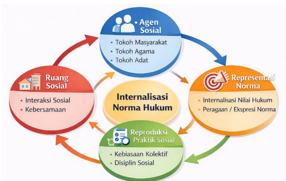
Gambar 3. Mekanisme Lapangan Internalisasi Norma Hukum.

Analisis tematik memperlihatkan adanya pola berulang dalam proses internalisasi norma, terdiri atas empat tahapan, yaitu pengenalan norma melalui informasi atau sosialisasi, penafsiran dan adaptasi norma melalui figur institusional, serta perulangan tindakan dalam konteks sosial sehari-hari, pembiasaan hingga menjadi orientasi tindakan. Temuan ini digambarkan dalam gambar 3. Skema ini memperjelas bahwa keberulangan praktik sosial merupakan kunci utama, bukan sekadar sosialisasi.