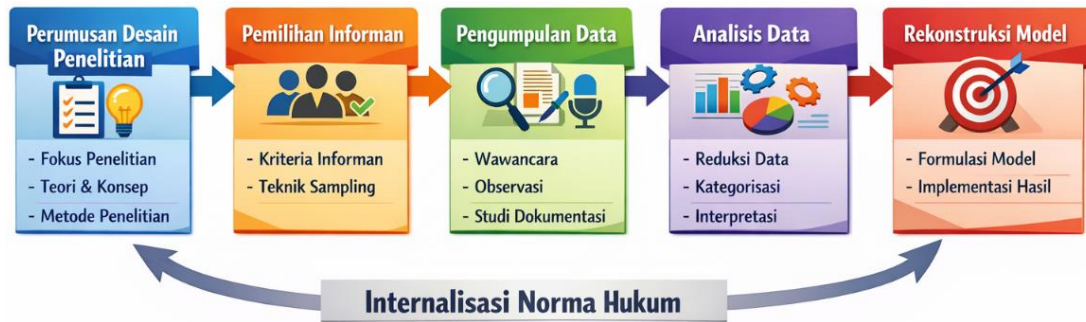
Gambar 1. Tahapan Metode Penelitian Internalisasi Norma Hukum