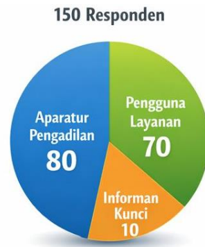
Gambar 2. Distribusi Responden dan Informan Penelitian

memungkinkan penelitian menguji konsistensi antara akuntabilitas internal (pertanggungjawaban administratif) dan akuntabilitas eksternal (pertanggungjawaban kepada publik). Keseimbangan tersebut penting dalam menilai apakah sistem administrasi telah memenuhi prinsip akuntabilitas lembaga negara secara menyeluruh atau masih terbatas pada pertanggungjawaban internal semata.