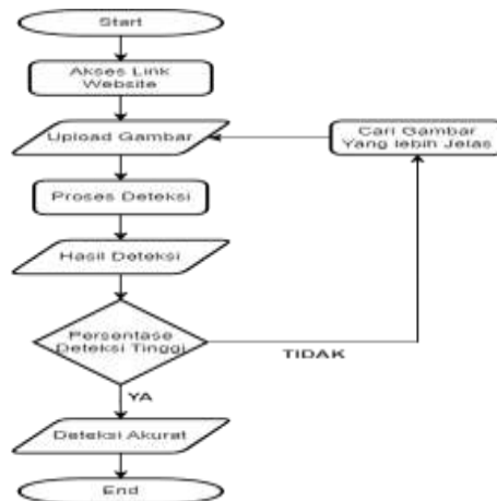
Gambar 2. Digram Flowchart Uji Model

Saat website bisa diakses maka akan muncul segmen upload file gambar penyakit dan terdapat pilihan tombol untuk memilih file dan upload file. Pada bagian memilih file, user akan diberikan pilihan untuk memilih sebuah gambar yang ada pada folder komputer user. Setelah user menentukan gambar yang dipilih maka proses yang dilakukan berikutnya adalah mengklik tombol upload file.