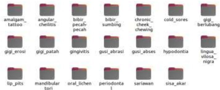
Gambar 4. Setelah Split Data

def split_data_into_class_folders(path_to_data, class_id): imgs_paths = glob.glob(path_to_data + '*.jpg') for path in imgs_paths: basename = os.path.basename(path) if basename.startswith(str(class_id) + '_'): path_to_save = os.path.join(path_to_data, penyakit_classes[class_id]) if not os.path.isdir(path_to_save): os.makedirs(path_to_save) shutil.move(path, path_to_save)