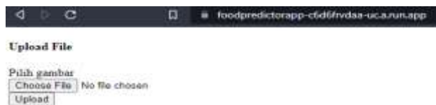
Gambar 8. Halaman Website Muncul