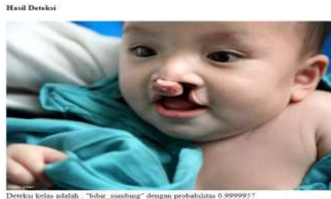
Gambar 11. Gambar Berhasil Dideteksi

Setelah gambar berhasil diunggah klik deteksi untuk melakukan proses deteksi nama kelas penyakit.