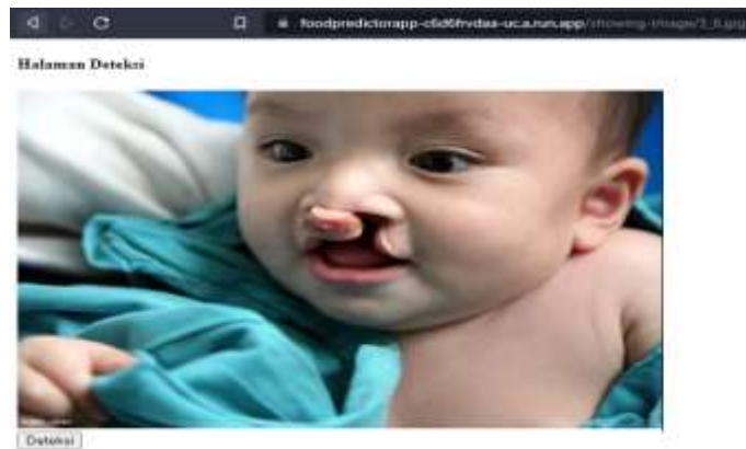
Gambar 10. Gambar Berhasil Diunggah