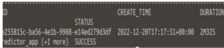
Gambar 6. Dockerfile berhasil di-push