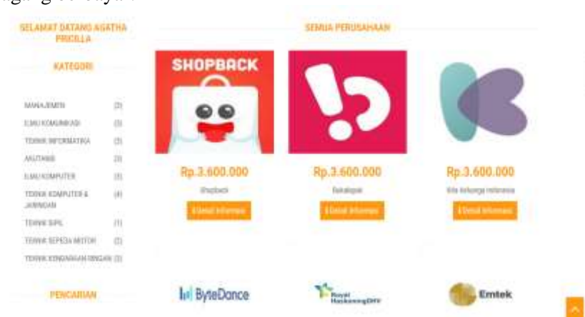
Gambar 2. Home

Hasil penelitian seperti pada gambar 2 akan ditampilkan informasi dari perusahaan yang menyediakan magang berbayar.