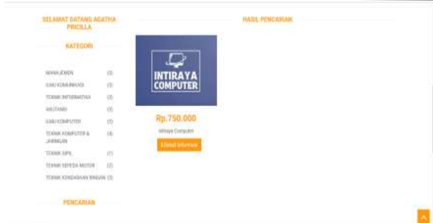
Gambar 4. Hasil Pencarian

Pelamar dapat melakukan tracking atau pelacakan status pengajuan magang yang pernah diajukan dengan memasukkan nomor pengajuan magang pada menu tracking kemudian klik tombol tracking untuk menampilkan hasil tracking . Jika pengajuan magang disetujui akan ditampilkan seperti gambar seperti gambar 5 dengan warna hijau.