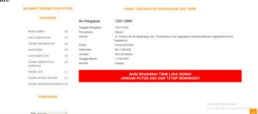
Gambar 6. Magang Tidak Disetujui

Jika pengajuan magang tidak disetujui akan ditampilkan seperti gambar seperti gambar 6 dengan warna merah.