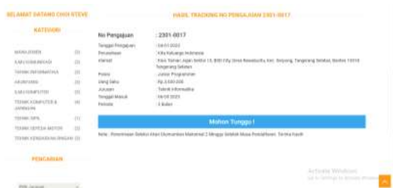
Gambar 6. Magang Masih Diproses