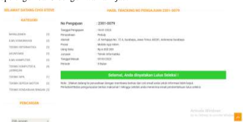
Gambar 5. Magang Disetujui

Pelamar dapat melakukan tracking atau pelacakan status pengajuan magang yang pernah diajukan dengan memasukkan nomor pengajuan magang pada menu tracking kemudian klik tombol tracking untuk menampilkan hasil tracking . Jika pengajuan magang disetujui akan ditampilkan seperti gambar seperti gambar 5 dengan warna hijau.