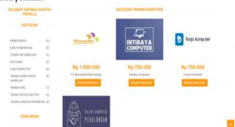
Gambar 3. Pemilihan Kategori

Pelamar dapat memilih kategori perusahaan yang menyediakan magang berbayar seperti gambar 3. Pada menu kategori akan ditampilkan informasi nama perusahaan dan jumlah magang yang dapat diajukan oleh pelamar.