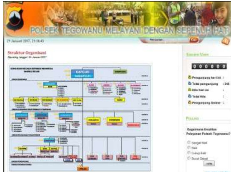
Gambar 4 Halaman Stuktur Organisasi

Untuk mengaksesnya Masyarakat Kecamatan Tegowanu dapat, mengklik menu Stuktur Organisasi Pada halaman struktur organisasi ini member kan gambaran struktur Petugas Polsek Tegowanu baik dari Petugas Lapangan maupun seksi-seksi dalam Petugas Polsek Tegowanu.