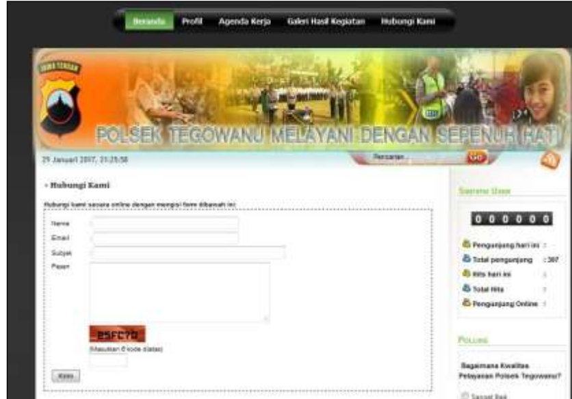
Gambar 2 Halaman Hubungi Kami

Dengan mengklik link buat Hubungi Kami maka Masyarakat Kecamatan Tegowanu dapat menghubungi Petugas Polsek Tegowanu melalui pesan singkat dan memberikan saran dan kritik.