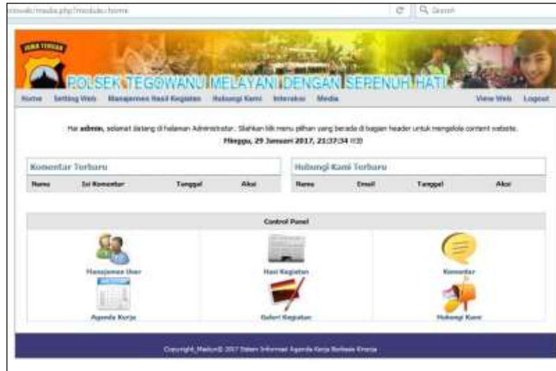
Gambar 6 Halaman utama admin

Halaman utama admin merupakan letak dimana menu-menu untuk manajemen web dan isinya secara keseluruhan. Untuk mengaksesnya hanya user yang didaftarkan yang bisa masuk.