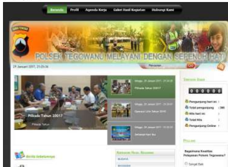
Gambar 1 Halaman Utama