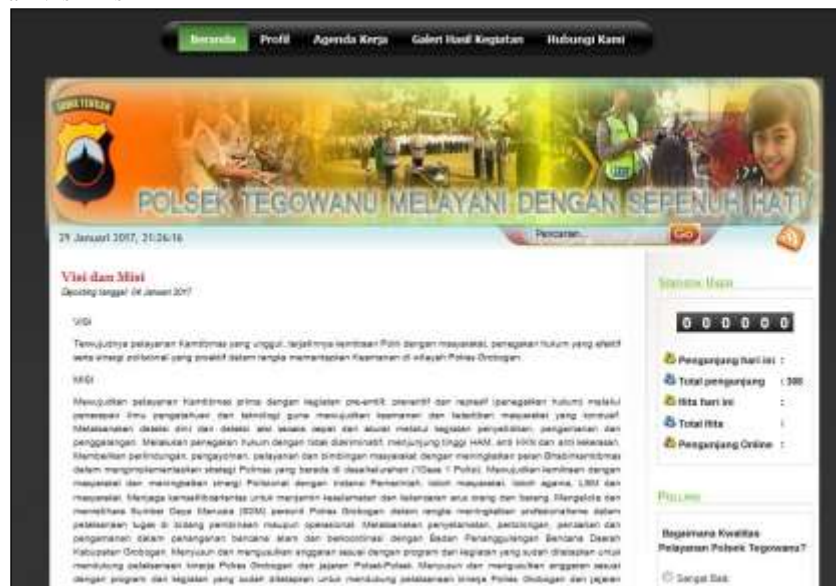
Gambar 3 Visi Misi