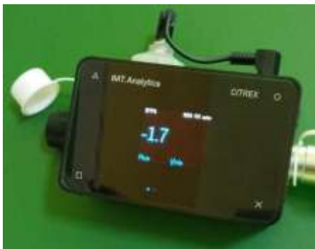
Gambar 7. Gas Flow Analyzer