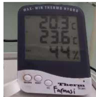
Gambar 8. Thermohygrometer