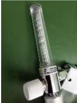
Gambar 3. Flowmeter Oksigen Fress

Objek untuk melakukan penelitian ini menggunakan 3 flowmeter oksigen produk dalam negeri dan 1 flowmeter oksigen produk luar negeri, pengukur suhu ruangan dan Gas Flow Analyzer. Berikut adalah data dan gambar alat gas flow analyzer, alat flowmeter, dan pengukur suhu dan kelembaban ruangan yang digunakan untuk pengambilan data.