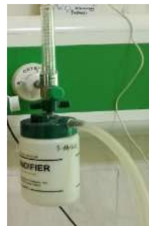
Gambar 6. Flowmeter Oksigen Timeter