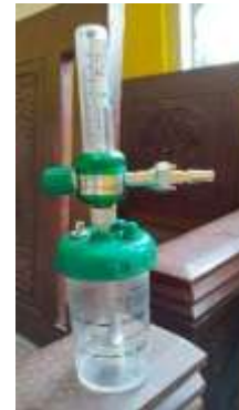
Gambar 4. Flowmeter Oksigen Koike