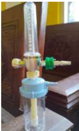
Gambar 5. Flowmeter Oksigen Anzon