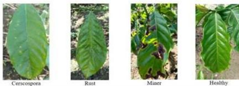
Gambar 1. Menunjukkan gambar daun kopi yang sehat dan yang terkena gangguan yang umum.