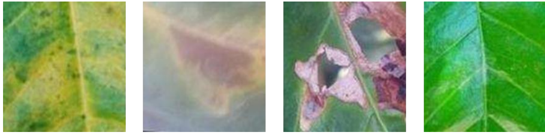
Gambar 2. Contoh sampel gambar daun kopi dari proses yang ditingkatkan.