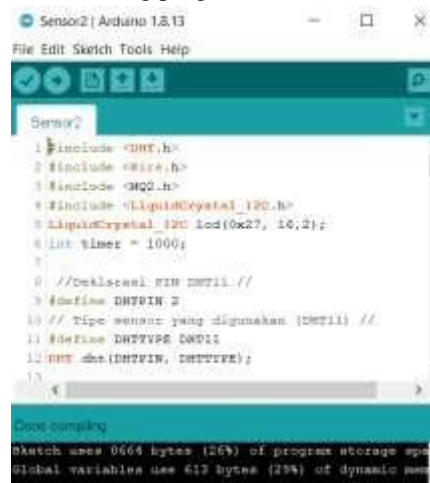
Gambar 5. Proses Verify