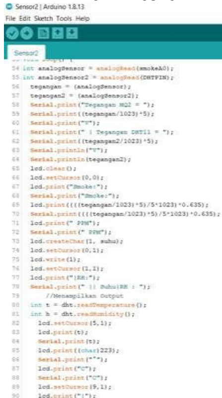
Gambar 4. Listing Program