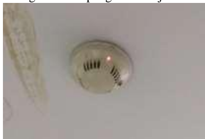
Gambar 1. Sensor Asap Ruang Server

Dalam hal ini sensor asap yang digunakan telah berumur lebih dari 15 tahun dan tidak dianjurkan untuk digunakan lagi. Disarankan untuk melakukan pergantian setiap 5 atau 10 tahun sekali agar tingkat efektivitasnya selalu baik. Dari hasil pengamatan yang telah dilakukan dapat disimpulkan bahwa sensitivitas pada sensor sudah berkurang dan mempengaruhi kerja dari alarm dan juga led pada sensor.