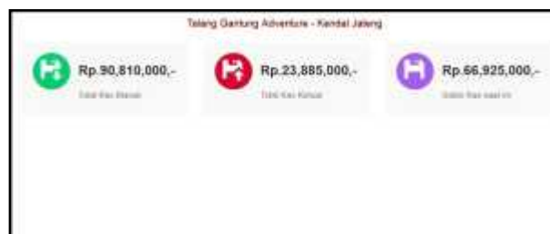
Gambar 4 Halaman Home

Menu Home menampilkan halaman awal pengguna setelah berhasil login