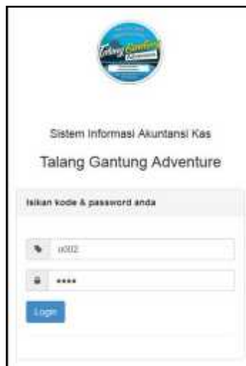
Gambar 2 Halaman Login Pengguna

Didalam aplikasi website sistem informasi akuntansi manajemen keuangan Talang Gantung Adventure ini terdapat 3 hak akses yaitu kasir, administrasi dan pemilik yang diberikan hak akses sebagai administrator.