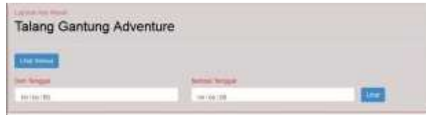
Gambar 16 Halaman Laporan Kas Masuk

Sub menu laporan kas masuk digunakan untuk menampilkan laporan kas masuk secara keseluruhan atau periode tanggal.