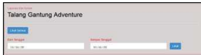
Gambar 18 Halaman Laporan Kas Keluar

Sub menu laporan kas keluar digunakan untuk menampilkan laporan kas keluar secara keseluruhan atau periode tanggal.