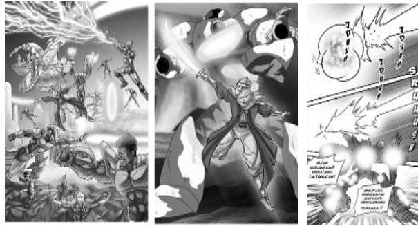
Gambar 4 Contoh gambar spesial efek pada halaman komik Ultimate Glad

b) Terdapat karakter utama dan para superhero yang mengenakan kostum bertopeng dan armor pada buku volume 1 yang berjudul Komik Ultimate Glad kekuatan Iman di halaman 37 (gambar para superhero mengenakan kostum atau armor ), halaman 128 (gambar para superhero bergabung mengenakan kostum dan armor ), halaman 154 (karakter Utama bernama Zetrow mengenakan armor ) dan lain sebagainya.