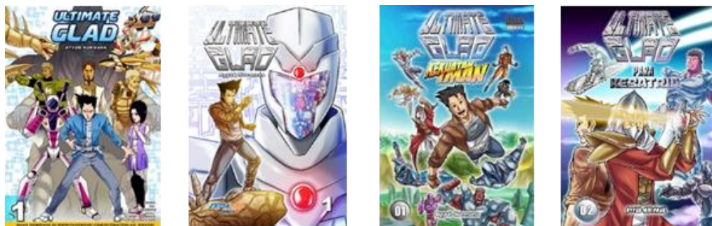
Gambar 2 komik Ultimate Glad versi 2012, versi 2019, dan versi 2020

Komik Ultimate Glad merupakan komik karya anak bangsa bernama Ayyub Nurmana. Sejak kecil Ayyub Nurmana sangat gemar bercerita melalui gambar, beliau alumni jurusan DKV (Desain Komunikasi Visual). Komikus serius menjadi komikus sejak tahun 2012. Setelah komikus lulus kuliah, komikus berusaha fokus mengerjakan komik. Komik bertema religi yang dikemas secara unik melalui komik, komikus ingin mengajak diri dan semua pembaca untuk lebih mengenal sang pencipta agar menjadi manusia-manusia yang berhasil meraih kebahagiaan di dunia dan akhirat. Dunia butuh orang-orang yang istiqomah dengan keimanan yang memiliki aqidah yang kokoh agar dunia bisa terselamatkan itulah cita-cita Ayyub Nurmana. Karya komikus tersebut sudah terbit dalam bentuk cetak dan digital. Komik tema religi nya dikemas dalam berbagai genre , antara lain: action , Edukasi, Comedy , Romance dan juga termasuk Tokusatsu (Nurmana Ayyub, 2021).