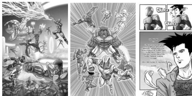
Gambar 5 Contoh gambar para superhero mengenakan kostum dan armor pada halaman komik Ultimate glad

b) Terdapat karakter utama dan para superhero yang mengenakan kostum bertopeng dan armor pada buku volume 1 yang berjudul Komik Ultimate Glad kekuatan Iman di halaman 37 (gambar para superhero mengenakan kostum atau armor ), halaman 128 (gambar para superhero bergabung mengenakan kostum dan armor ), halaman 154 (karakter Utama bernama Zetrow mengenakan armor ) dan lain sebagainya.