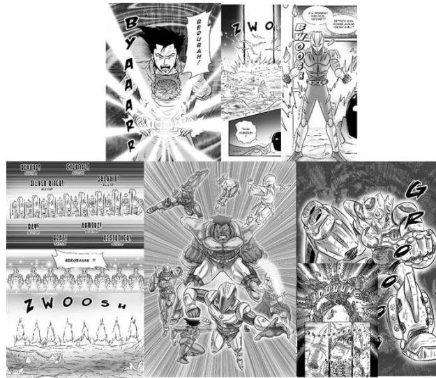
Gambar 8 Contoh gambar transformasi atau henshin pada halaman komik Ultimate glad