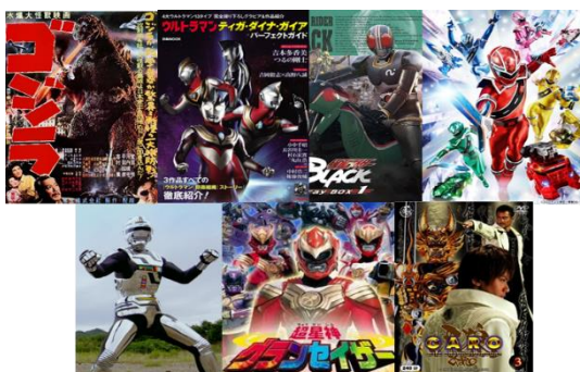
Gambar 1 Kaiju, Ultraman, Kamen Rider, Super Sentai (dari kiri atas), Metal Hero, Chouseishin, Garo (dari kiri bawah)

Istilah Tokusatsu secara etimologi merupakan kependekan dari istilah Tokushu Satsuei (特殊撮影) yang memiliki arti Special Photography atau Special Effect , dalam bahasa Indonesia disebut sebagai fotografi spesial yang mengacu pada penggunaan efek spesial. Fotografi atau pengambilan gambar bergerak (video) dalam pembuatan efek film agar menciptakan suatu hal yang bersifat imajinatif. Efek film tersebut menggunakan teknik komputer dan menghasilkan gambar animasi yang menarik. Sebagai contoh, adalah membuat efek sinar yang terlihat seperti sambaran petir dari pukulan-pukulan yang merupakan jurus para tokohnya (Ananza Okky, 2016:1).