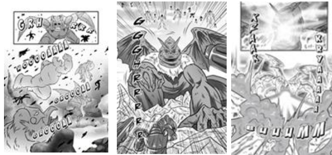
Gambar 7 Contoh gambar para monster/kaiju pada halaman komik Ultimate Glad

d) Terdapat monster atau kaiju sebagai karakter antagonis dalam buku komik volume 1 yang berjudul Komik Ultimate Glad kekuatan Iman , terbukti pada halaman 41 (gambar para monster yang sedang menyerang kota Senterra), halaman 58-59 (gambar monster raksasa sebagai musuh atau karakter antagonis), dan lain sebagainya.