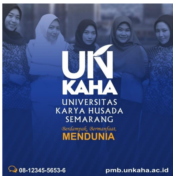
Gambar 1. Poster Digital 1

Gambar 1. Menjelaskan bahwa Universitas Karya Husada Semarang (UNKAHA) kini hadir dengan wajah baru melalui strategi rebranding yang dirancang untuk meningkatkan daya saing dan kesadaran merek (brand awareness) di tengah masyarakat. Dengan tampilan visual yang lebih modern dan slogan “Berdampak, Bermanfaat, Mendunia”, UNKAHA berhasil menciptakan identitas yang lebih kuat dan profesional di mata publik. Berdasarkan hasil penelitian, rebranding ini terbukti efektif, di mana sebanyak 85% responden mampu mengenali logo baru universitas, 82% menyatakan citra UNKAHA menjadi lebih positif, dan 78% merasa lebih tertarik untuk mencari informasi lebih lanjut mengenai kampus. Strategi ini menunjukkan bahwa langkah rebranding bukan hanya perubahan tampilan, tetapi juga upaya membangun kepercayaan dan memperkuat posisi universitas dalam dunia pendidikan tinggi yang kompetitif.