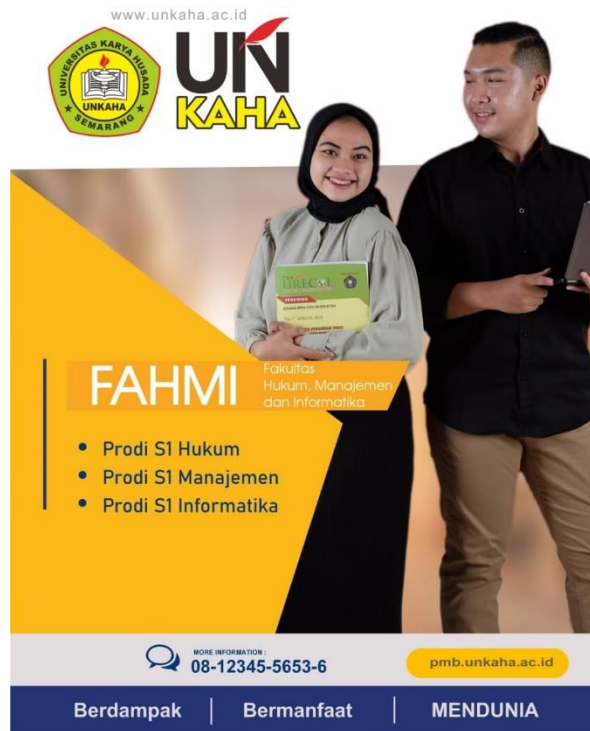
Gambar 2. Poster Digital 2

Gambar 2. Menjelaskan Universitas Karya Husada Semarang terus menunjukkan komitmennya dalam mencetak lulusan unggul dan berdaya saing melalui Fakultas Hukum, Manajemen, dan Informatika (FAHMI). Dengan program studi S1 Hukum, S1 Manajemen, dan S1 Informatika, UNKAHA membuka peluang bagi generasi muda untuk menempuh pendidikan tinggi berkualitas yang relevan dengan kebutuhan dunia kerja masa kini. Didukung oleh dosen profesional, kurikulum adaptif, serta fasilitas berbasis teknologi informasi, FAHMI menjadi pilihan tepat untuk menyiapkan masa depan yang gemilang. Tak hanya berfokus pada akademik, setiap mahasiswa juga dibekali dengan keterampilan praktis dan nilai integritas tinggi sesuai visi UNKAHA: Berdampak, Bermanfaat, Mendunia.