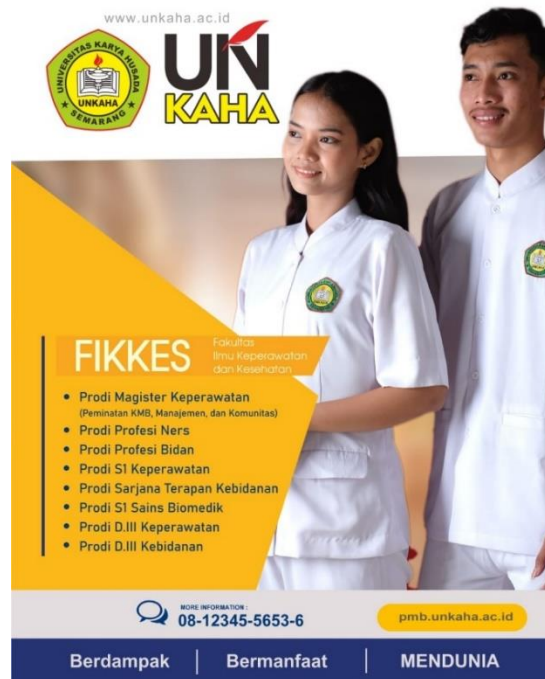
Gambar 3. Poster Digital 3

Gambar 3. Merupakan media promosi digital yang menawarkan calon mahasiswa Menjadi tenaga kesehatan bukan hanya tentang profesi, tetapi tentang pengabdian dan dampak nyata bagi kehidupan. Fakultas Ilmu Keperawatan dan Kesehatan (FIKKES) Universitas Karya Husada Semarang hadir sebagai tempat tumbuhnya para calon tenaga medis yang tidak hanya kompeten, tetapi juga humanis dan berintegritas. Dengan berbagai pilihan program studi mulai dari Magister Keperawatan, Profesi Ners, Profesi Bidan, hingga Sains Biomedik dan D-III Kebidanan, FIKKES UNKAHA berkomitmen mencetak lulusan yang siap terjun langsung di masyarakat dengan keilmuan, empati, dan semangat pengabdian. Di tengah dinamika global dunia kesehatan, FIKKES siap menjawab tantangan zaman dan menjadi garda terdepan dalam mencetak SDM kesehatan yang berdampak, bermanfaat, dan mendunia.