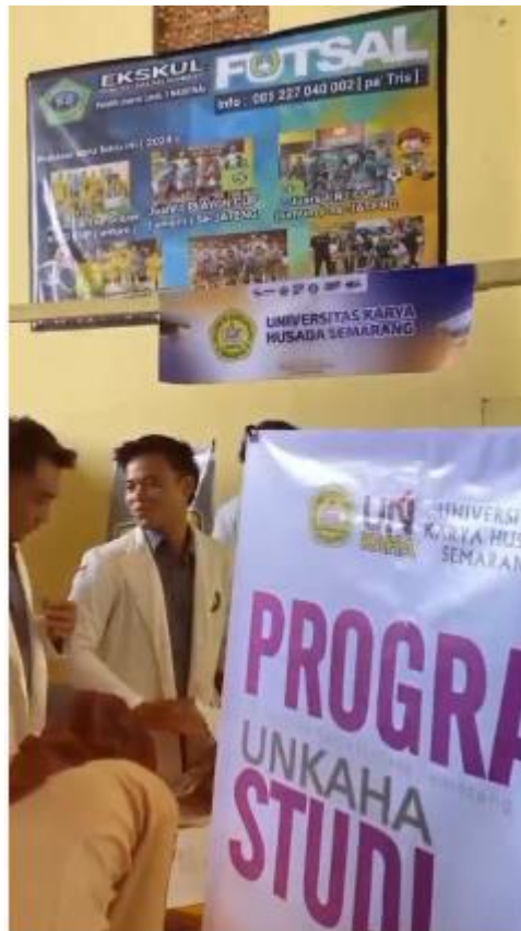
Gambar 5. Video Sosial Media 2

Gambar 4. Merupakan Video promosi yang dihasilkan menjadi representasi dari wajah baru universitas, menampilkan nilai, visi, serta keunggulan institusi secara visual dan komunikatif. Dengan pendekatan desain yang modern dan narasi yang inspiratif, media ini diharapkan mampu memperkuat citra institusi dan meningkatkan daya tarik universitas di tengah persaingan pendidikan tinggi.