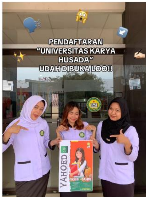
Gambar 6. Video Sosial Media 3

Gambar 6. memperlihatkan video promosi yang dirancang untuk mencerminkan identitas baru Universitas Karya Husada Semarang, dengan menekankan nilai-nilai utama, visi, serta keunggulan institusional melalui tampilan visual yang atraktif dan komunikatif. Mengadopsi gaya desain modern dan narasi yang inspiratif, video ini bertujuan memperkuat citra Universitas serta menarik perhatian masyarakat, terutama calon mahasiswa. Sebagai bagian dari strategi pemasaran digital, video ini direncanakan akan dipublikasikan melalui media sosial, khususnya TikTok, agar dapat menjangkau kalangan muda secara lebih luas dan efektif.