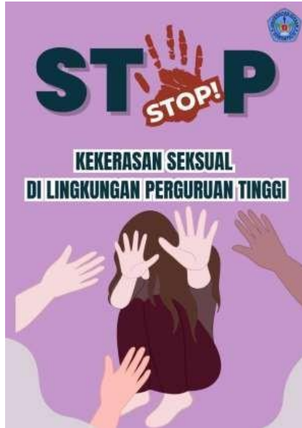
Gambar 4. 1 Desain Poster Stop Kekerasan

Poster dirancang dengan tujuan menyampaikan pesan pencegahan kekerasan seksual secara singkat dan menarik. Elemen utama: