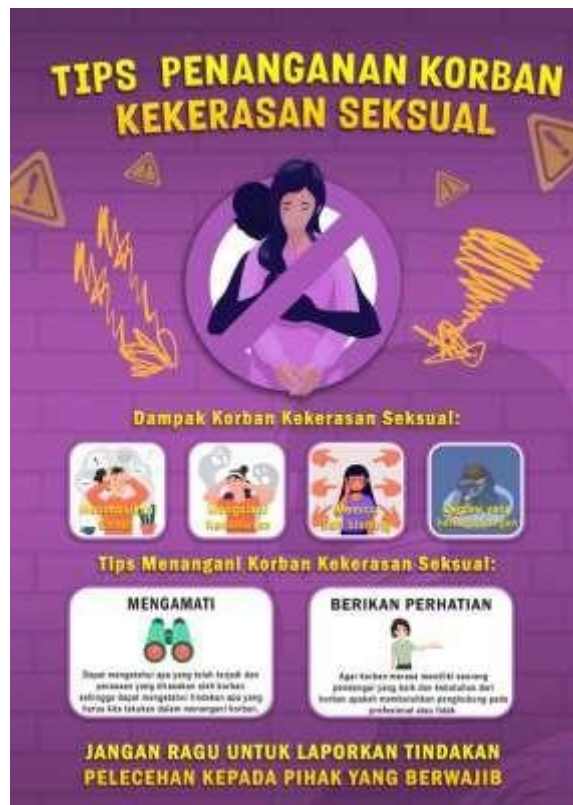
Gambar 4. 2 Desain Infografis

Infografis dirancang untuk menyajikan informasi secara ringkas dan visual.