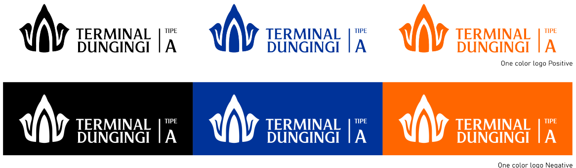
Gambar 6 Variasi Warna pada Logo dengan Background Hitam Putih

Sedangkan variasi warna untuk penerapan tertentu seperti iklan satu warna dan desain grafis, gunakanlah logo dengan 1 warna. Logo hitam sebaiknya digunakan untuk iklan hitam putih dan fax. Warna positif dan negatif hanya dapat digunakan dengan background warna putih dan hitam.