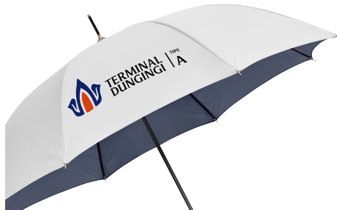
Gambar 16 Souvenir Payung

Selain berfungsi untuk melindungi dari terik matahari dan saat hujan, payung juga difungsikan sebagai media promosi yang sangat menarik. Karena souvenir payung merupakan alat promosi yang cukup mudah dijangkau semua kalangan dan memiliki bidang atau media cetak yang luas.