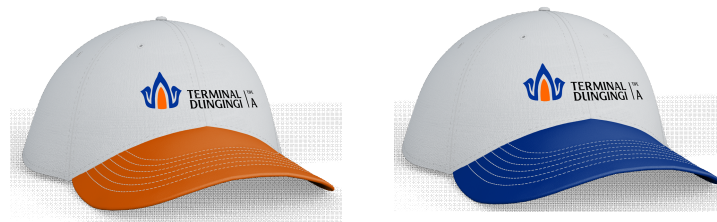
Gambar 13 Topi Porter (Kiri) dan Topi Driver (Kanan)

Fungsi topi selain menjadi aksesoris, juga diperuntukkan untuk karyawan sebagai pelindung kepala dan rambut dari terik matahari. Topi jelas digunakan pada saat bekerja dilapangan, dalam hal ini porter dan driver. Warna topi porter dan driver pun dibedakan menjadi warna oranye untuk porter dan biru untuk driver.