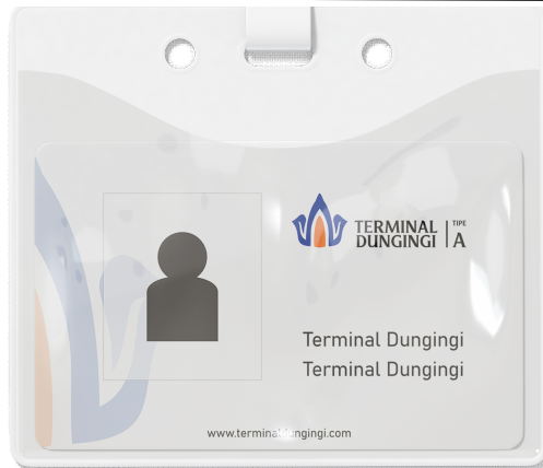
Gambar 12 Tanda Pengenal