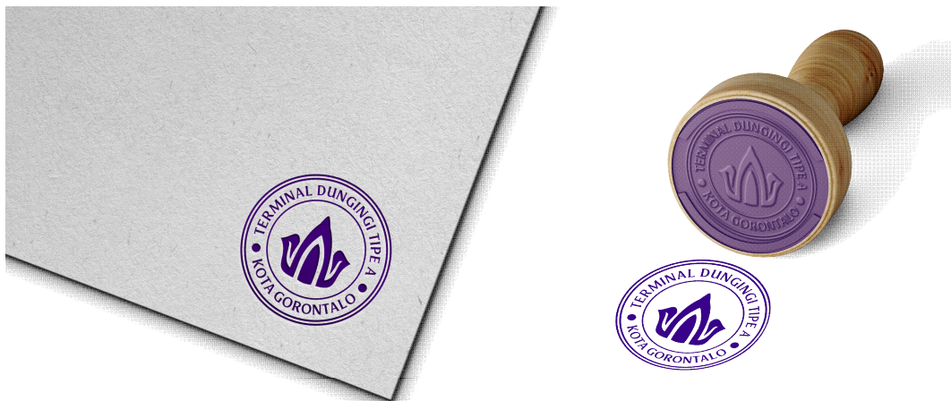
Gambar 11 Stamp / Cap

Fungsi cap perusahaan sebenarnya sama seperti tanda tangan atau cap jempol. Dalam hal mengesahkan sebuah dokumen penting, dokumen yang dibubuhi stamp / cap memiliki kekuatan hukum yang mengikat.