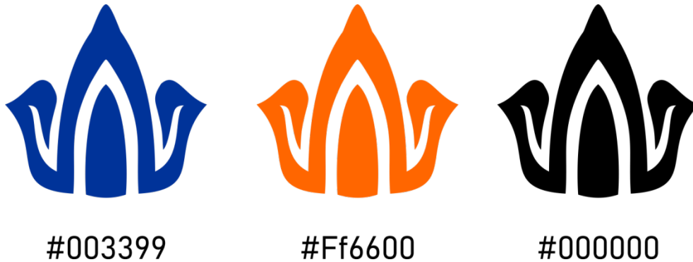
Gambar 5 Warna pada Logo

Warna yang dipilih membantu membangun perhatian asosiasi dengan brand. Warna dasar utama adalah warna putih yang didukung oleh 2 warna pada logo dan 1 warna pada logotype. 3 warna tersebut dipilih untuk mendukung dan menonjolkan seluruh warna sabagai satu kesatuan.