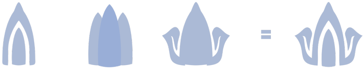
Gambar 3 Sketsa Logo dari Kubah, Jagung, dan Topi Adat Gorontalo

Logo terdiri dari 3 bagian, yaitu kubah, jagung, dan topi adat Gorontalo, yang merupakan ikon kota Gorontalo. Dimana kubah menjadi simbol dari kota Gorontalo dengan sebutan serambi madinah. Simbol jagung yang melekat dengan makanan khas daerah Gorontalo Binthe Biluhuta . Begitu juga dengan topi adat Gorontalo. Logo ini digabungkan menjadi satu kesatuan yang mempresentasikan bahwa terminal Dungi adalah mitra untuk menopang, merangkul, melindungi, demi mencapai tujuan jasa transportasi.