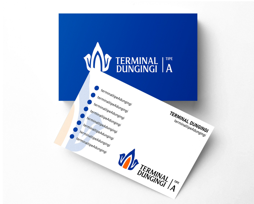
Gambar 10 Kartu Nama