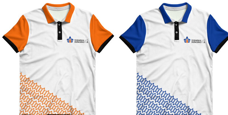
Gambar 14 Baju Porter (Kiri) dan Baju Driver (Kanan)

Fungsi seragam sejatinya sama seperti tanda pengenal agar mudah dikenali ketika berada ditempat ramai. Dalam hal ini terminal Duingingi. Seragam porter dan driver dibedakan menjadi dua warna seperti topi. Oranye untuk porter dan biru untuk driver.