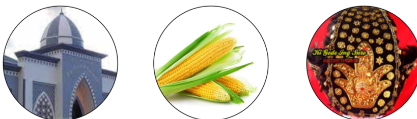
Gambar 1 Kubah, Jagung, Topi adat Gorontalo

Dalam tahapan awal perancangan identitas visual branding, peneliti merancang sebuah logo dan logotype dari terminal Duingingi. Konsep logo terdiri dari ilustrasi ikonik dari kota Gorontalo yaitu, kubah, jagung, dan topi adat Gorontalo.